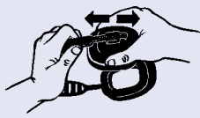
2 Trekk klokkene lengst ned på bøylen