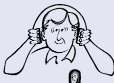
3 Skyv så opp klokkene slik at de dekker hele øret.