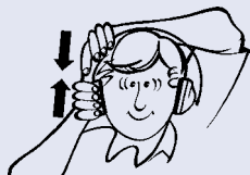
4 Juster klokkene på begge sider for optimal tilpassing.