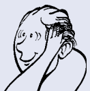
1 Ta håret bort fra ørene.